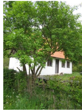
Beværrerhuset maj 2014