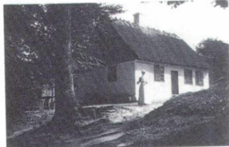
Beværrerhuset havde oprindelig stråtag. Ældre foto, (sommeren 1903).